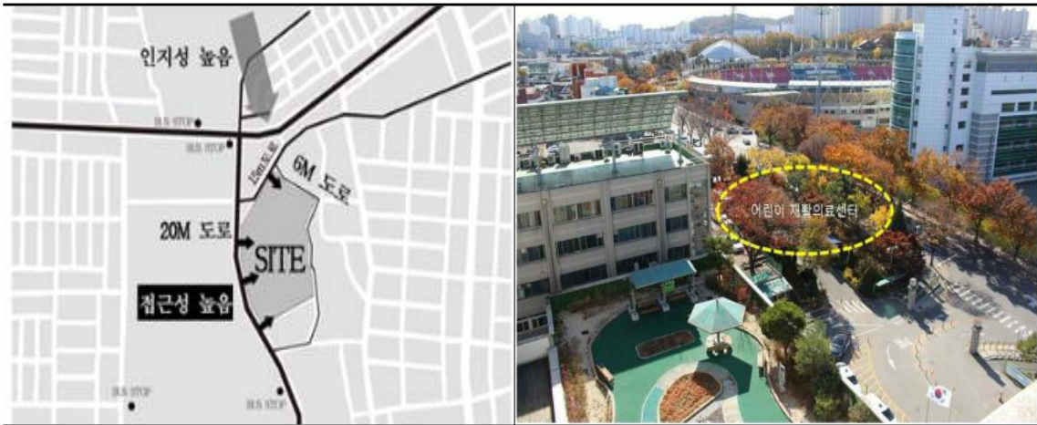
대지 정보 및 별동 증축 위치